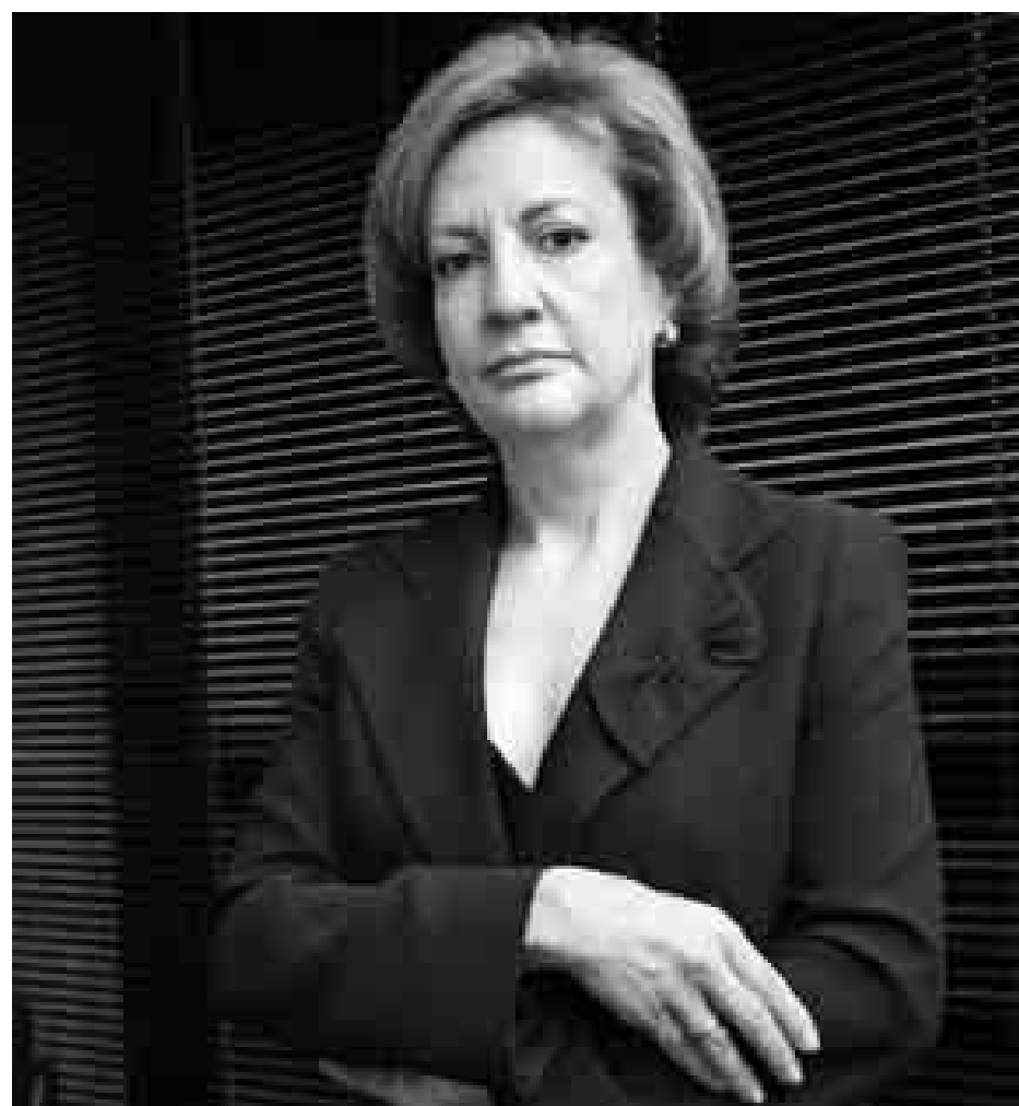
Teresa Cochito considera que a área tecnológica está cheia de oportunidades a nível nacional e não só.

Penso que Belmiro de Azevedo se destaca pela audácia, pelo alto nível de internacio-