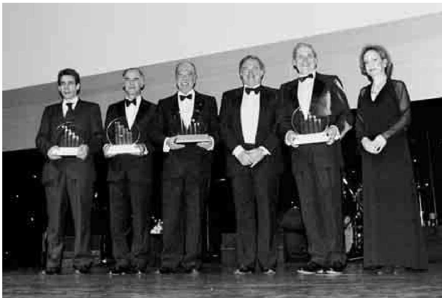
Os vencedores da edição deste ano posam com os galardões na mão, acompanhados pela responsável da Ernst & Young e pelo presidente do júri, Basílio Horta.

Para vencer, é preciso “não só acreditarem nas suas ideias, mas demonstrarem capacidade para torná-las realidade”, diz a empresa organizadora. Por isso, no concurso que já decorreu em Novembro passado estiveram presentes as características do empreendedor, o seu perfil e percurso profissional, mas também as características da empresa da qual é CEO. Depois, é analisada também a estratégia da empresa, no que respeita ao posicionamento no mercado e factores do sucesso; é feita uma avaliação económico-financeira da empresa (analisando-se o crescimento, a rentabilidade económica e financeira, a qualidade dos investimentos, a estrutura financeira, a qualidade de gestão financeira e a gestão de riscos); estuda-se a gestão de recursos humanos (a partir da evolução dos efectivos, formação, nível de qualificação, métodos de motivação e de coesão social entre trabalhadores e gestores de topo);